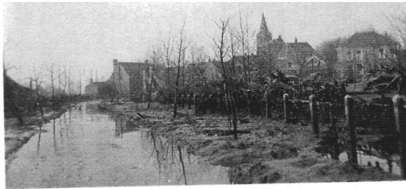
Gezicht op Noordwelle